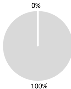
2. Taxonomiekonformität der Investitionen ohne Staatsanleihen*